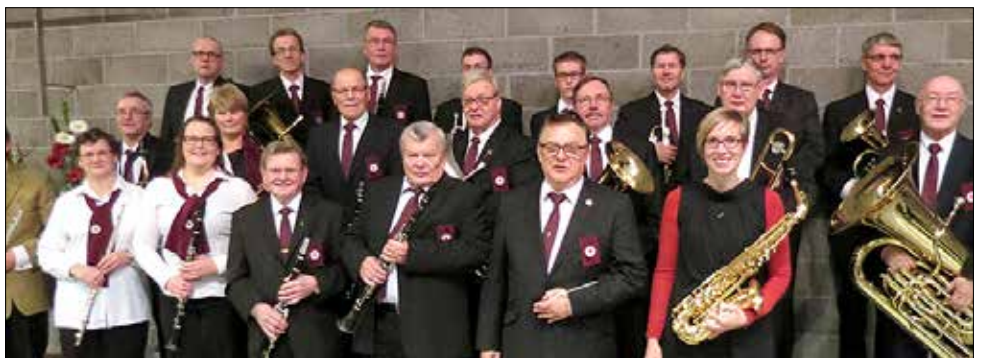
Pohjanmaan evankelinen puhallinorkesteri vierailee sunnuntaina 7. kesäkuuta Euran seurakunnassa ja esiintyy Euran ja Kiukaisten kirkoissa.